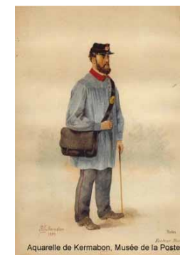
Aquarelle de Kermabon, Musée de la Poste

De plus, si vous le souhaitez, vous pourrez à titre individuel profiter de l'exposition " Nouvelles du paradis, la carte postale de vacances " prolongez les vacances en explorant l'histoire de cet objet touristique.